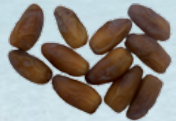
datte Deglet Nour